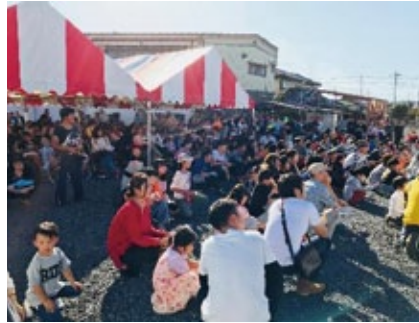
過去最高 6,000 人余の方にご来場いただきました

今回は会場を「栄町通り」に移して十月二十一日(日)に開催されました。晴天にも恵まれて、午前中からたくさんの方の来場者で賑わいました。 ステージでは、園児によるお遊戯やダンスなどの熱いパフォーマンスで盛り上がりました。 また、お楽しみ企画では、「千本釣り」「お楽しみ抽選会」に長蛇の列ができていました。「ビンゴ大会」も賞品に狙いを定め、ワクワクドキドキ、最後まで笑顔の「賑わい祭」となりました。(小堀 記)