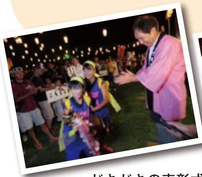
ドキドキの表彰式

本年度は約4,000発の花火が打ちあがりました。ご協賛いただきましたみなさま誠にありがとうございました。