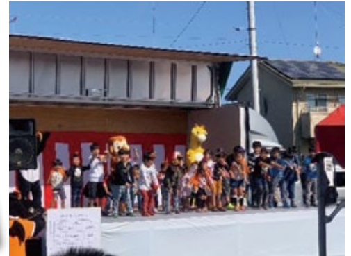
園児たちの可愛い姿