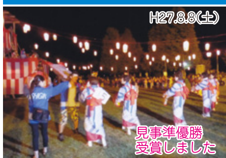
見事準優勝 受賞しました