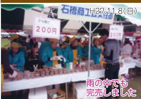
雨の中でも 完売しました